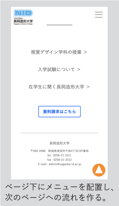
ページ下にメニューを配置し、次のページへの流れを作る。